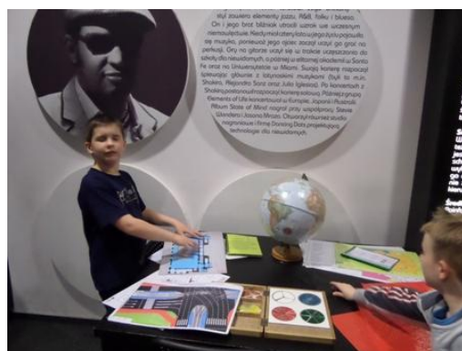
Uczniowie klasy 2 c z wychowawcą