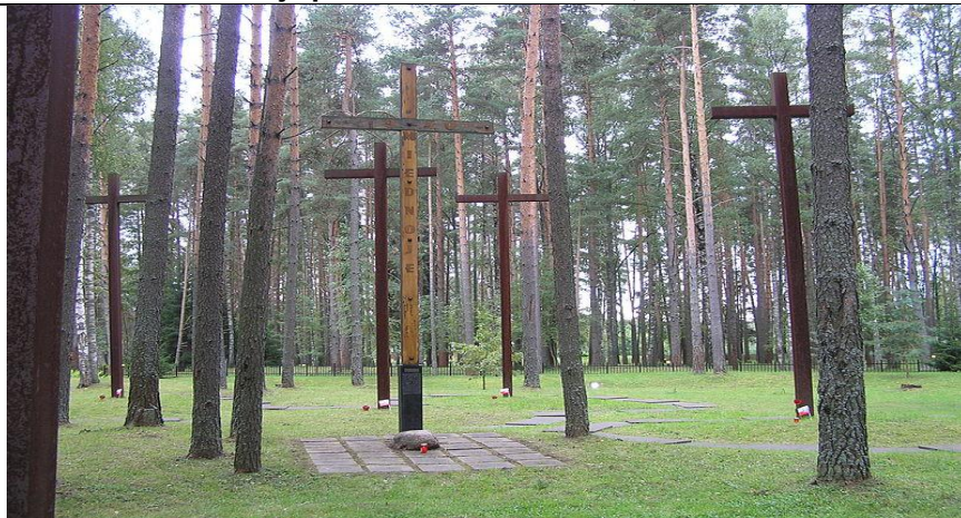
Polski Cmentarz Wojenny w Miednoje „Doły Śmierci” oznaczone krzyżami