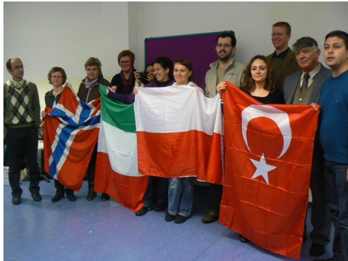
Nauczyciele ze szkół partnerskich , którzy brali udział w spotkaniu

Austriacy gospodarze zapewnili nam ciekawy program: zwiedzanie zabytków Wiednia, wizytę w oczyszczalni ścieków, filtrach wiedeńskich oraz Muzeum Techniki. Mieliśmy również okazję uczestniczyć w lekcjach naszych kolegów z Austrii, braliśmy też udział w ciekawych zajęciach prowadzonych na terenie ich szkoły.